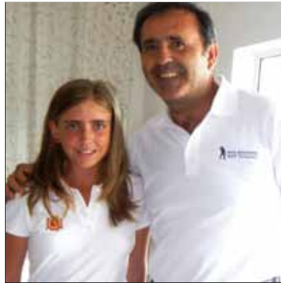
Severiano Ballesteros con la redactora, Celia Barquín

- Participaste seis veces en la Ryder Cup, y fuiste capitán de, para muchos, la Ryder más bonita ganada por Europa. En 2010 ganó Europa y te dedicaron el triunfo, sigues siendo un ídolo para ellos, ¿cómo te sientes por ello?